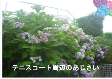
テニスコート周辺のあじさい