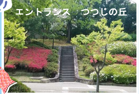
エントランス つつじの丘