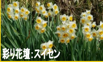
彩り花壇:スイセン