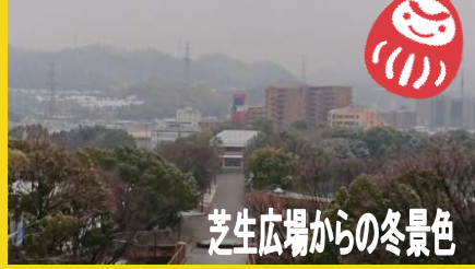
芝生広場からの冬景色