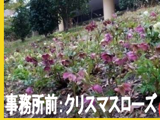
事務所前:クリスマスローズ