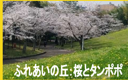
ふれあいの丘:桜とタンポポ