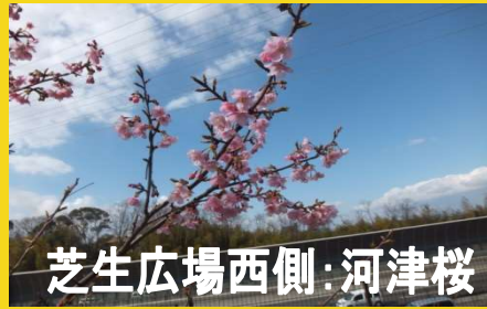
芝生広場西側:河津桜