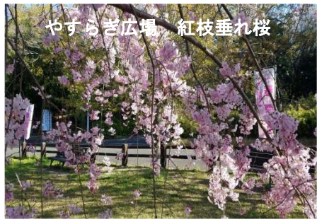
やすらぎ広場 紅枝垂れ桜