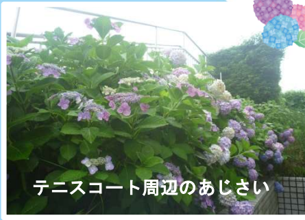
テニスコート周辺のあじさい