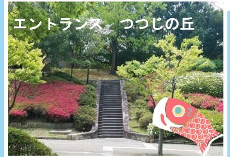
エントランス つつじの丘