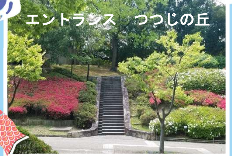
エントランス つつじの丘