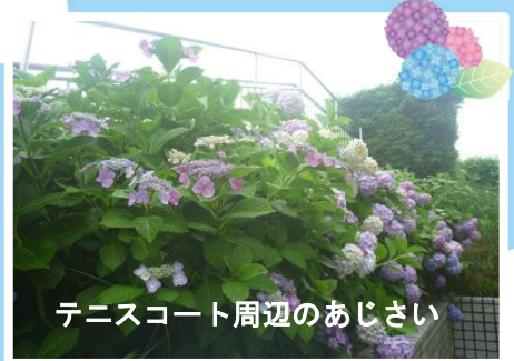
テニスコート周辺のあじさい