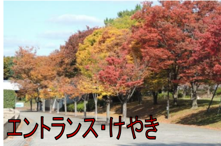
エントランス・けやき