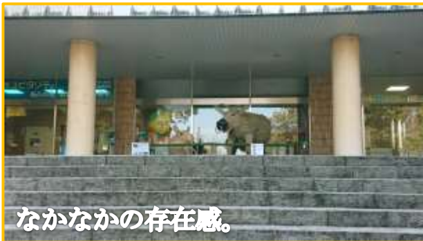
なかなかの存在感。

現在の干支を作るきっかけとなった平成 24 年の、辰にちなんだ藁のゴジラから 10 年、巳年のヤマタノオロチ、酉年の火の鳥、申年の孫悟空などを盛り込みながら今日まで続けてこられています。今回は先日まで寝屋川市役所ロビーに展示されていた干支の丑と去年の干支の子をお借りしました。2月11日(木) 時間未定まで展示予定です。公園内壁泉のイーゼルには過去 10 年分の干支とんどの写真を展示しています。是非ご覧くださいね。