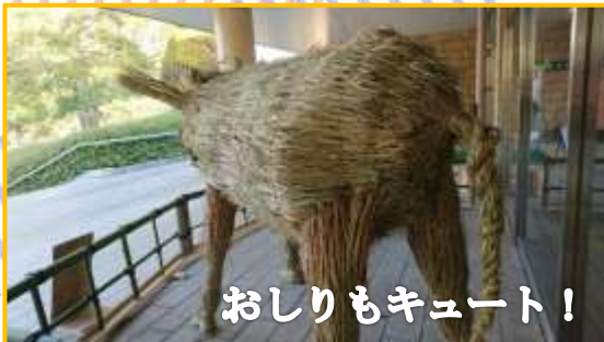
おしりもキュート！