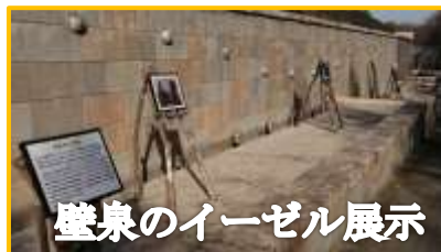
壁泉のイーゼル展示