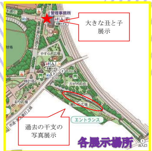
大きな丑と子 展示