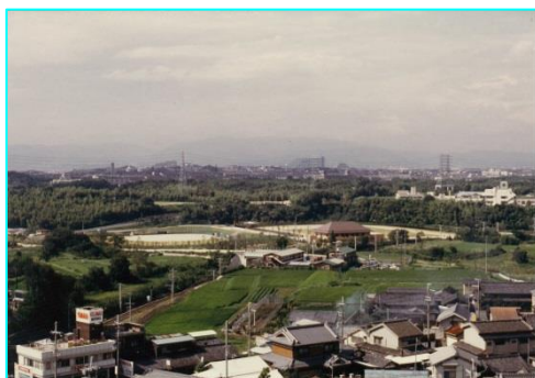
JR東寝屋川駅のほうから撮影。今では近くに大きなショッピングモールが出来、すっかり、さま変わりです。