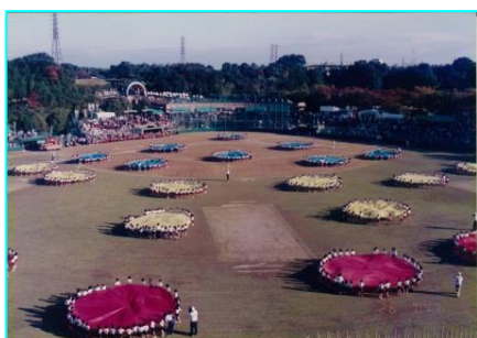
なみはや国体。園児たちのバルーン演技です。