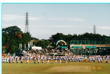
なみはや国体。地元の方々による民舞です。