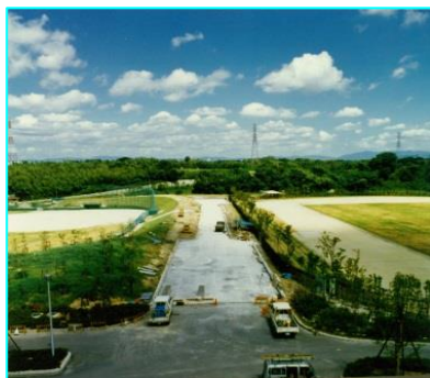
昭和59年ごろ第1野球場、陸上競技場を建設中です。

1997年（平成9年）なみはや国体公式マスコットで、2014年（平成26年）に『もずやん』に改名。