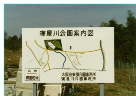
園内地図ですが、まだ何もありませんね。

寝屋川公園は、1982年（昭和57年）にソフトボール広場、芝生広場の完成を待って一部開園しました。その時はたったの4.5ha（ヘクタール）からのスタートでした。東京ドームとほぼ同じ広さだったのですね。