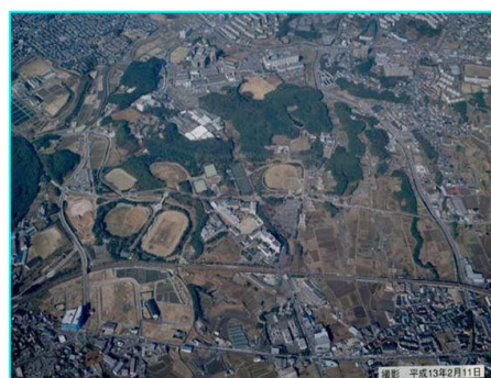
航空写真です。あちこちに、今の施設のもととなる広場が出来始めてます。