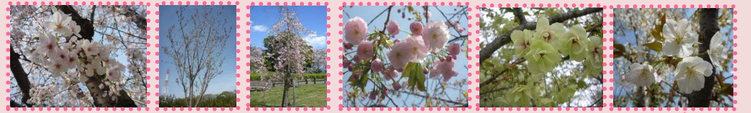
ソメイヨシノ サトザクラ 垂れ桜 八重桜 御衣黄 ヤマザクラ

寝屋川公園には園内全域で約300本の桜の木があります。 今はまだ小さい木ですが、芝生広場西側にある河津桜(カワツザクラ)から咲き始め、 園内に一番多いソメイヨシノ、サトザクラ、やすらぎ広場の垂れ桜、八重桜、黄色い桜 の御衣黄、5月頃咲くヤマザクラまで、一ヶ月以上楽しませてくれます。