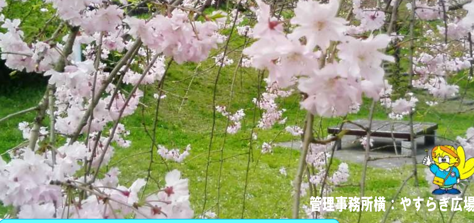
管理事務所横：やすらぎ広場